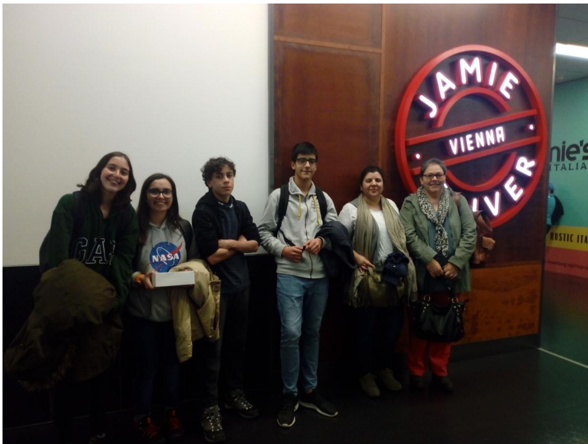
C1- Grupo português à ida para a Bulgária

Os quatro alunos em mobilidade foram selecionados entre as turmas do 9°C e 9°E e cujo perfil de competências se encontra exposto.