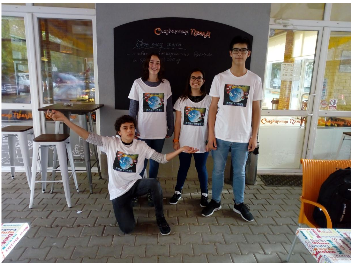
Dia do anúncio do logotipo vencedor

Uma vez que os resultados serão em inglês, a barreira do idioma pode ser um problema, mas no site ( http://griots.curie.pl/ ) forneceremos traduções em todos os idiomas dos parceiros do projeto, assim a disseminação do projeto será mais simples.