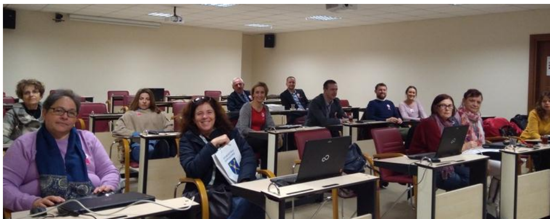
Edirne - Turquia

Em fevereiro foi lançado o concurso para a escolha do logotipo do projeto. Este concurso foi ganho por Portugal (63,7% dos votos).